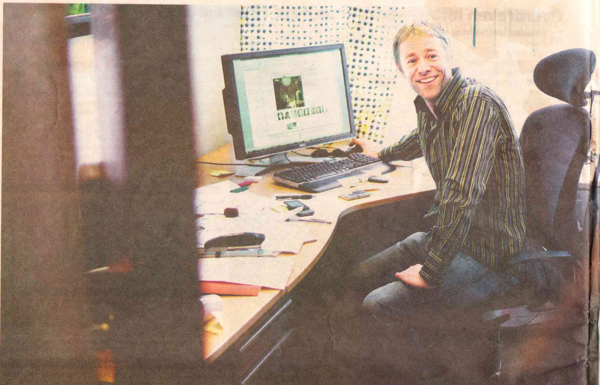
Sur musikk: Den norske nettdatingtjenesten Sukker.no og