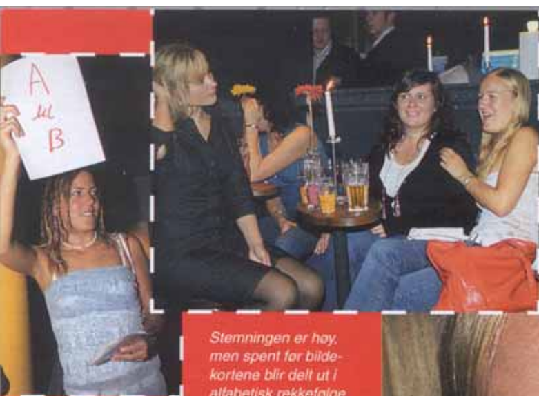
Stemningen er høy, men spent for bildkortene blir delt ut i alfabetisk rekkefølge.