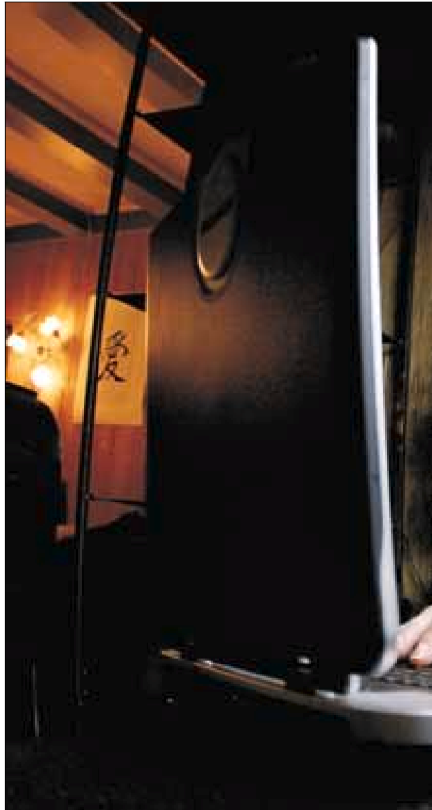
DATEKLAR: Datingen fungerer slik at brukerne legger inn sin profil på en nett (24) håper å finne drømmepartneren på lørdagens fest, der internettbrukeres